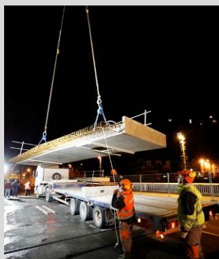
Dalles de pont